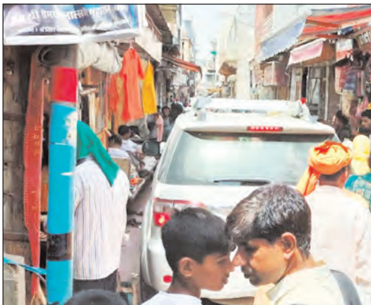
फोटो परिचय-वृंदावन की सड़की गलियों में लगा जाम।

वृंदावन की कुंज गलियों में बाहर से आने वाली गाड़ियां प्रवेश कर जाती हैं।