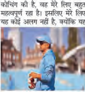
आखिरी ऐसा मैच होगा, जिसकी जिम्मेदारी मैं संभालूंगा, उन्होंने यह पुष्टि करने पर कि क्या यह टूर्नामेंट टीम की जिम्मेदारी संभालने के लिए उनका आखिरी टूर्नामेंट था, कहा। पूर्व भारतीय कप्तान ने उस साल टी20 विश्व कप के बाद नवंबर 2021 में टीम की कप्तान संभाली थी। उन्होंने कहा, मुझे यह काम करना बहुत पसंद है।

एजेंसी नई दिल्ली। पूर्व कप्तान राहुल द्रविड़ ने घोषणा की है कि आगामी टी20 विश्व कप भारतीय क्रिकेट टीम के मुख्य कोच के रूप में उनका आखिरी कार्यभार होगा। न्यूयॉर्क में आयरलैंड के खिलाफ भारत के पहले मैच से पहले बोलते हुए द्रविड़ ने कहा, 'यह आखिरी ऐसा मैच होगा, जिसकी I will take the responsibility' द्रविड़ ने व्यस्त कार्यक्रम और अपनी मौजूदा जीवन अवस्था को इस पद के लिए दोबारा आवेदन न करने का कारण बताया। आयरलैंड के खिलाफ भारत के विश्व कप के पहले मैच से पहले पत्रकारों से बात करते हुए द्रविड़ ने कहा कि उन्होंने अपने कोचिंग कार्यकाल का हर पल का लुफ उठाया। हर टूर्नामेंट महत्वपूर्ण होता है। भारत के लिए मैंने जो भी मैच कोचिंग की है, वह मेरे लिए बहुत महत्वपूर्ण रहा है। इसलिए मेरे लिए यह कोई अलग नहीं है, क्योंकि यह मुझे भारत को कोचिंग देने में बहुत मज़ा आया और मुझे लगता है कि यह वाकई एक खास काम है। मुझे इस टीम के साथ काम करने में मज़ा आया और यह काम करने वाले बेहतरीन लोगों का समूह है, लेकिन हाँ, दुर्भाग्य से जिस तरह के शेड्यूल हैं और मैं अपने जीवन के जिस पड़ाव पर हूँ, उसे देखते हुए मुझे नहीं लगता कि मैं फिर से आवेदन कर पाऊँगा। तो हाँ, जाहिर है कि यह मेरा आखिरी काम होगा, लेकिन ईमानदारी से कहूँ तो मेरे लिए भी यह अलग नहीं है। जब से मैंने यह काम संभाला है, मुझे हमेशा लगा है कि हर 'Game is important है और हर खेल मान्य रहता है और यह नहीं बदलता, उन्होंने जोर देकर कहा। भारत का लक्ष्य एक मायावी ICC ट्रॉफी जीतना और कोच को एक बेहतरीन विदाई देना होगा।