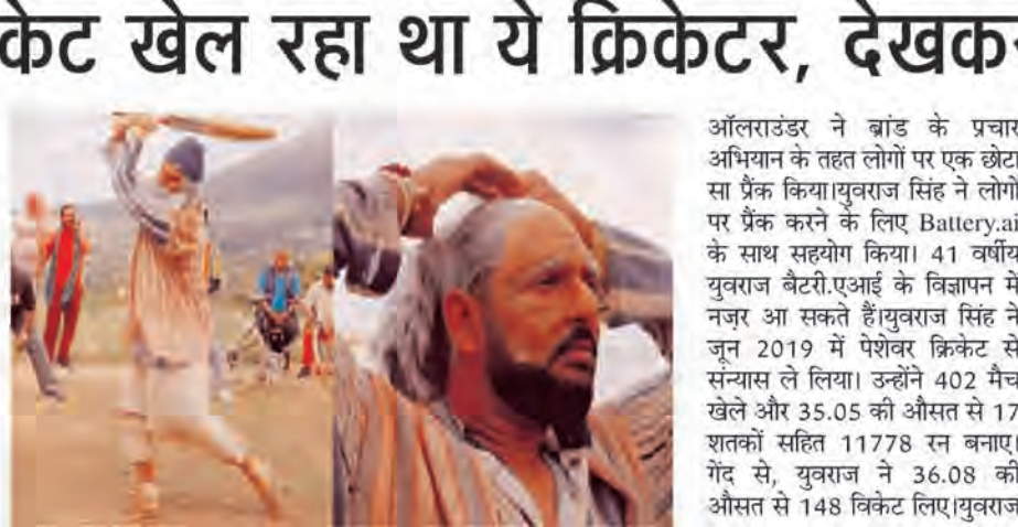
ऑलराउंडर ने ब्रांड के प्रचार अभियान के तहत लोगों पर एक छोटा सा प्रैक किया। युवराज सिंह ने लोगों को लक्ष्य के लिए Battery.ai के साथ सहयोग किया। 41 वर्षीय युवराज बैटरी.आई के विज्ञापन में नजर आ सकते हैं। युवराज सिंह ने जून 2019 में पेशेवर क्रिकेट से संन्यास ले लिया। उन्होंने 402 मैच खेले और 35.05 की औसत से 17 शतकों सहित 11778 रन बनाए। गेंद से, युवराज ने 36.08 की औसत से 148 विकेट लिए। युवराज सिंह ने टीम इंडिया के लिए आखिरी बार जून 2019 में वेस्टइंडीज के खिलाफ एकदिवसीय मैच में हिस्सा लिया था। रिटायरमेंट के बाद, युवराज सिंह अपनी संस्था %यूवीकेन% के माध्यम से चैरिटी के काम में शामिल रहे हैं और लीजेंड्स लीग क्रिकेट में इंडिया लीजेंड्स के लिए भी खेले हैं। युवराज और बार फिर क्रिकेट में वापसी करेंगे, जब वह यूके में होने वाली वर्ल्ड चैंपियनशिप ऑफ लीजेंड्स के उद्घाटन संस्करण में इंडिया चैंपियंस की अगुआई करेंगे।