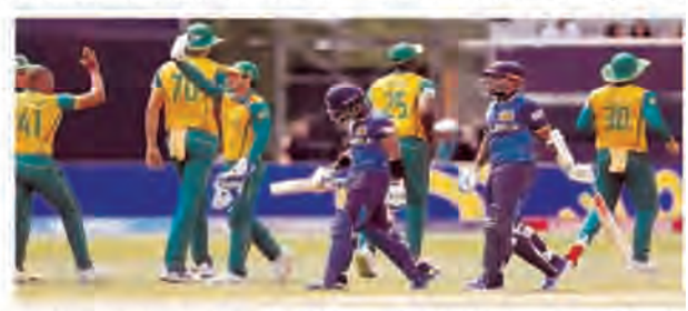
आलोचना की। पहले बल्लेबाजी करने के लिए कहे जाने के बाद, श्रीलंका को इस बात का कोई अंदाजा नहीं था कि प्रोटेरियाज गेंदबाजी आक्रमण का सामना कैसे करना है। श्रीलंका टी20ई में अपने सबसे कम स्कोर पर भी लुढ़क गईं। कुसल मंडिस, कामिंडु मंडिस और एंजेलो मैथ्यूज दोहरे अंकों में पहुंचे, लेकिन बड़ा स्कोर बनाने में नाकाम रहे। मंडिस उनके शीर्ष स्कोरर रहे जिन्होंने 30 गेंदों पर एक चौके की मदद से 19 रन बनाए, इससे पहले एनरिक नोर्तेजे ने क्राउन पर उनकी दयनीय स्थिति को समाप्त किया। पहली पारी के बाद, इरफान ने कहा कि न्यूयॉर्क की पिच किसी भी तरह से टी20 क्रिकेट के लिए आदर्श नहीं है। इरफान ने 'एक्स' पर लिखा, टी20 क्रिकेट के लिए आदर्श पिच नहीं है।

एजेंसी नासाउ काउंटी। पूर्व भारतीय ऑलराउंडर इरफान पटान ने टी20 विश्व कप 2024 के रूप डी मैच में श्रीलंका के 19.1 ओवर में 77 रन पर आउट होने के बाद न्यूयॉर्क के नासाउ काउंटी इंटरनेशनल Cricket Stadium की पिच की आलोचना की। पहले बल्लेबाजी करने के लिए कहे जाने के बाद, श्रीलंका को इस बात का कोई अंदाजा नहीं था कि प्रोटेरियाज गेंदबाजी आक्रमण का सामना कैसे करना है। श्रीलंका टी20ई में अपने सबसे कम स्कोर पर भी लुढ़क गईं। कुसल मंडिस, कामिंडु मंडिस और एंजेलो मैथ्यूज दोहरे अंकों में पहुंचे, लेकिन बड़ा स्कोर बनाने में नाकाम रहे। मंडिस उनके शीर्ष स्कोरर रहे जिन्होंने 30 गेंदों पर एक चौके की मदद से 19 रन बनाए, इससे पहले एनरिक नोर्तेजे ने क्राउन पर उनकी दयनीय स्थिति को समाप्त किया। पहली पारी के बाद, इरफान ने कहा कि न्यूयॉर्क की पिच किसी भी तरह से टी20 क्रिकेट के लिए आदर्श नहीं है। इरफान ने 'एक्स' पर लिखा, टी20 क्रिकेट के लिए आदर्श पिच नहीं है। पावरप्ले में सिर्फ 1 विकेट खोने के बावजूद सिर्फ 24 रन बनाए। पावरप्ले के बाद भी, वे कभी भी गति नहीं दिखा पाए। एनरिक नोर्तेजे, जो आईपीएल में डीसी के लिए खेलते हुए Best Form में नहीं थे, खतरनाक नजर आ रहे हैं। उन्होंने 4-0-7-4 के आंकड़ों के साथ मैच समाप्त किया और पुरुष टी20 विश्व कप के इतिहास में किसी दक्षिण अफ्रीकी द्वारा सर्वश्रेष्ठ गेंदबाजी का रिकॉर्ड बनाया। करीसो रबाडा और बार एंथो के स्पिनर केसाव महाराज ने 2-2 विकेट लिए। ओटनील बार्टमैन ने भी 4-1-9-1 के आंकड़ों के साथ अपना काम बखूबी निभाया। मात्रात्मक रूप से 3.1-0-15-0 के आंकड़ों के बाद कोई सफलता हासिल करने में विफल रहे।