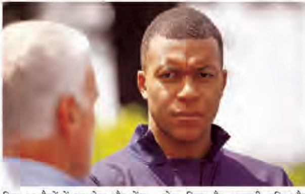
लिफ 60 मैचों में 27 गोल और फ्रेंच राष्ट्रीय टीम के लिए 77 मैचों में 46 गोल किया है। उनकी गति और शक्ति के साथ-साथ इस प्रभावशाली

एजेंसी मैड्रिड। रियल मैड्रिड ने पेरिस सेंट जर्मेन (पीएसजी) से फ्री ट्रांसफर पर फ्रांसीसी अंतरराष्ट्रीय खिलाड़ी किलियन एमबाप्पे के साथ करार किया है। 25 वर्षीय फारवर्ड ने हाल ही में चैम्पियंस लीग विजेता के साथ पांच साल का अनुबंध किया है। स्ट्राइकर ने सोशल मीडिया पर लिखा, मैं अपने सपनों के क्लब रियल मैड्रिड में शामिल होने के लिए बेसब्र हूँ। इस पल में मैं कितना खुश हूँ, यह बताना असंभव है। एमबाप्पे ने पीएसजी के लिए 308 मैचों में 256 गोल, मोनाको के लिए 60 मैचों में 27 गोल और फ्रेंच राष्ट्रीय टीम के लिए 77 मैचों में 46 गोल किए हैं। उनकी गति और शक्ति के साथ-साथ इस प्रभावशाली संख्याओं ने उन्हें यूक्रीन दुनिया का सबसे अच्छे स्ट्राइकर बना दिया है। मोनाको में उनके सफल होने के बाद से रियल मैड्रिड उनके साथ करार करने की कोशिश कर रहा था। एमबाप्पे वर्तमान में यूरोपीय चैंपियनशिप की तैयारी के लिए फ्रांसीसी राष्ट्रीय टीम के साथ हैं। रियल मैड्रिड को सहायता में एक और अच्छी खबर मिली, जिसमें पुष्टि की गई कि एमबाप्पे ओलंपिक खेलों में भाग नहीं लेंगे, जिसका अर्थ है कि वह 2024-2025 ला लीगा सीजन की शुरुआत के लिए उपलब्ध रहेंगे, जो अगस्त के मध्य में शुरू होगा।